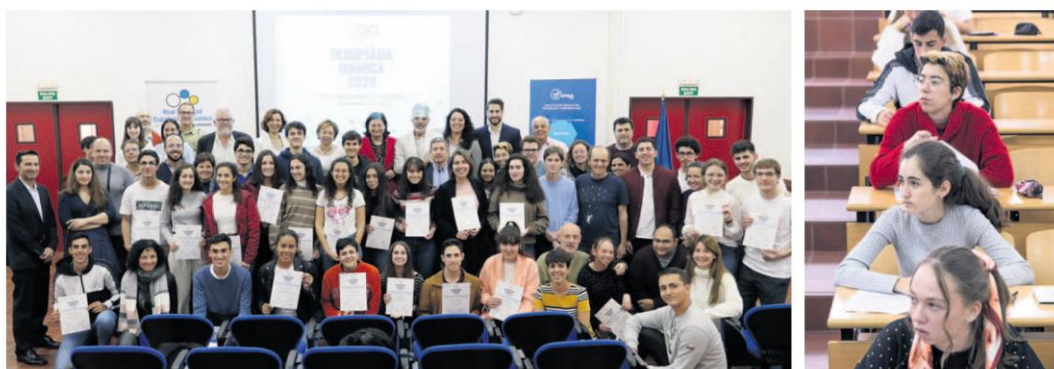
VARIAS IMÁGENES DE LA JORNADA CELEBRADA AYER EN LA SECCIÓN DE QUÍMICA DE LA FACULTAD DE CIENCIAS DE LA UNIVERSIDAD DE LA LAGUNA. Emeterio

22 da ACTUALIDAD Viernes, 6 de marzo de 2020