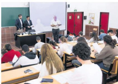
TENERIFE, LA PALMA Y GRAN CANARIA ENVIARON REPRESENTANTES A LA PRUEBA.